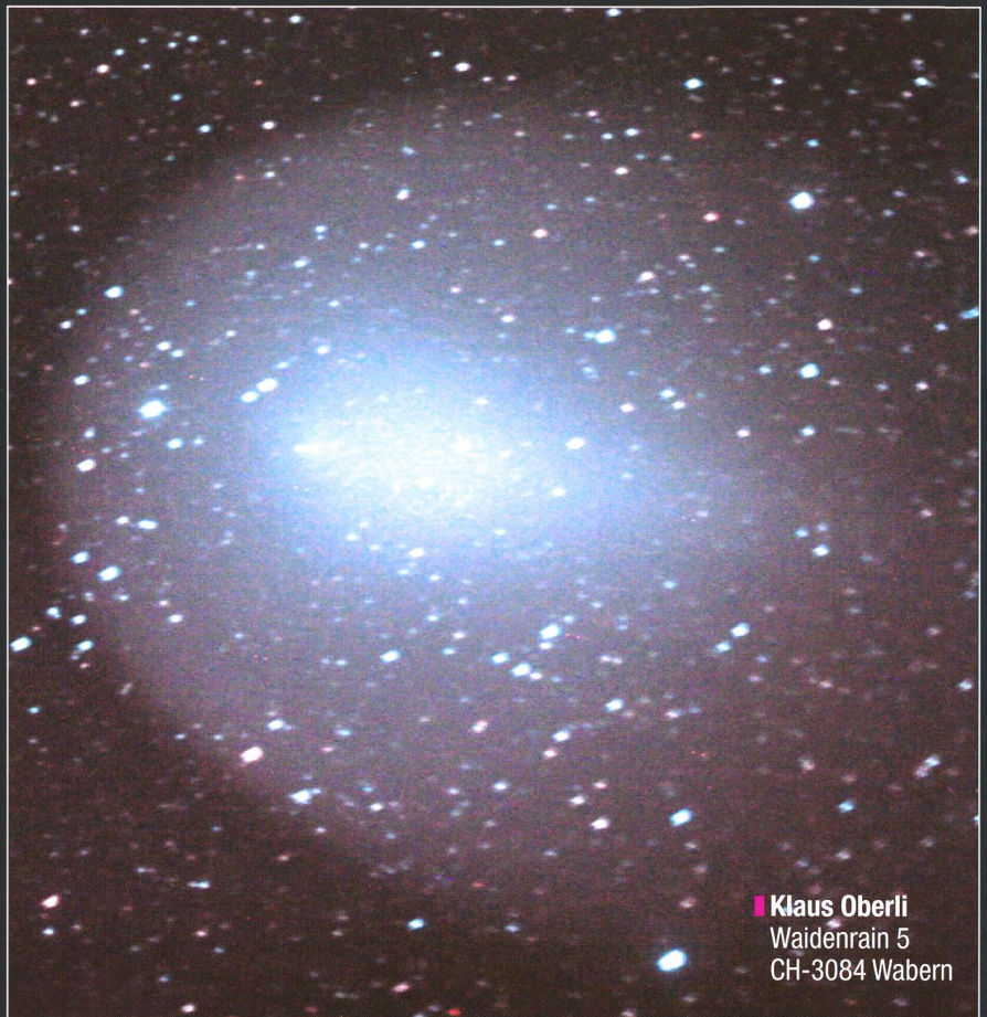
■ Klaus Oberli Waidenrain 5 CH-3084 Wabern

Ein Highlight der besonderen Art war im vergangenen Herbst der plötzlich aufgehellte Komet Holmes. An klaren Abenden konnte man den neuen «Star» im Sternbild Perseus leicht ausmachen. Mittlerweile ist seine Koma wegen der geringen Flächenhelligkeit verblasst. Viele spektakuläre Aufnahme, wie auch die nebenstehende erreichten die Redaktion. Das Bild von Klaus Oberli aus Wabern zeigt den Kometen am 9. Dezember 2007 während einer kurzen Wetteraufhellung, inmitten von Strassenlaternen und Gartenweihnachtslichtern. Umso erstaunlicher erscheint das Resultat. Die Aufnahme wurde mit einer Canon 20D plus UHC Filter an einem 15 cm Schmidt-Newton, f = 38 cm, 2 und 3 Minuten bei ISO 1600 aufgenommen und im Photoshop multipliziert. Weitere Berichte zu Komet Holmes finden Sie in der Rubrik «Fotogalerie» in dieser Ausgabe.