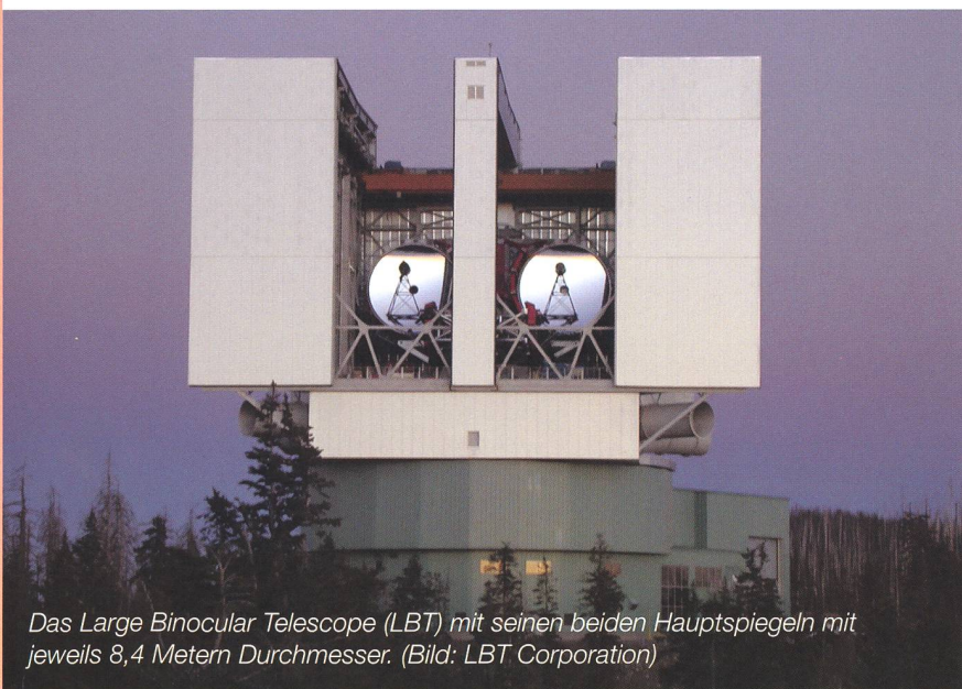
Das Large Binocular Telescope (LBT) mit seinen beiden Hauptspiegeln mit jeweils 8,4 Metern Durchmesser.

Auf dem 3190 Meter hohen Mount Graham in Arizona steht das weltgrößte Einzelteleskop, das Large Binocular Telescope (LBT). Zwei riesige Spiegel mit 8,4 Metern Durchmesser befinden sich auf einer gemeinsamen Montierung und machen das Instrument zu einem gigantischen Fernglas. Durch die Kopplung der Strahlengänge beider Einzelspiegel sammelt das LBT in seiner endgültigen Konfiguration so viel Licht, wie ein Fernrohr mit einem Hauptspiegel von 11,8 Metern Durchmesser. Das Lichtsammelvermögen übertrifft dasjenige des Weltraumteleskops Hubble um das 24-fache. Die Auflösung erreicht die eines 22,8-Meter-Teleskops, denn es verfügt über die modernste Adaptive Optik und die Bilder der Einzelspiegel können interferometrisch zu einem Gesamtbild überlagert werden. Die Astronomen sind damit in der Lage, die durch die Luftunruhe verursachte Unschärfe erdgebundener Aufnahmen zu kompensieren. Mit dieser Leistungsfähigkeit wird das LBT völlig neue Möglichkeiten zur Erforschung von Planeten ausserhalb des Sonnensystems und zur Untersuchung der schwächsten und am weitesten entfernten Galaxien bieten.