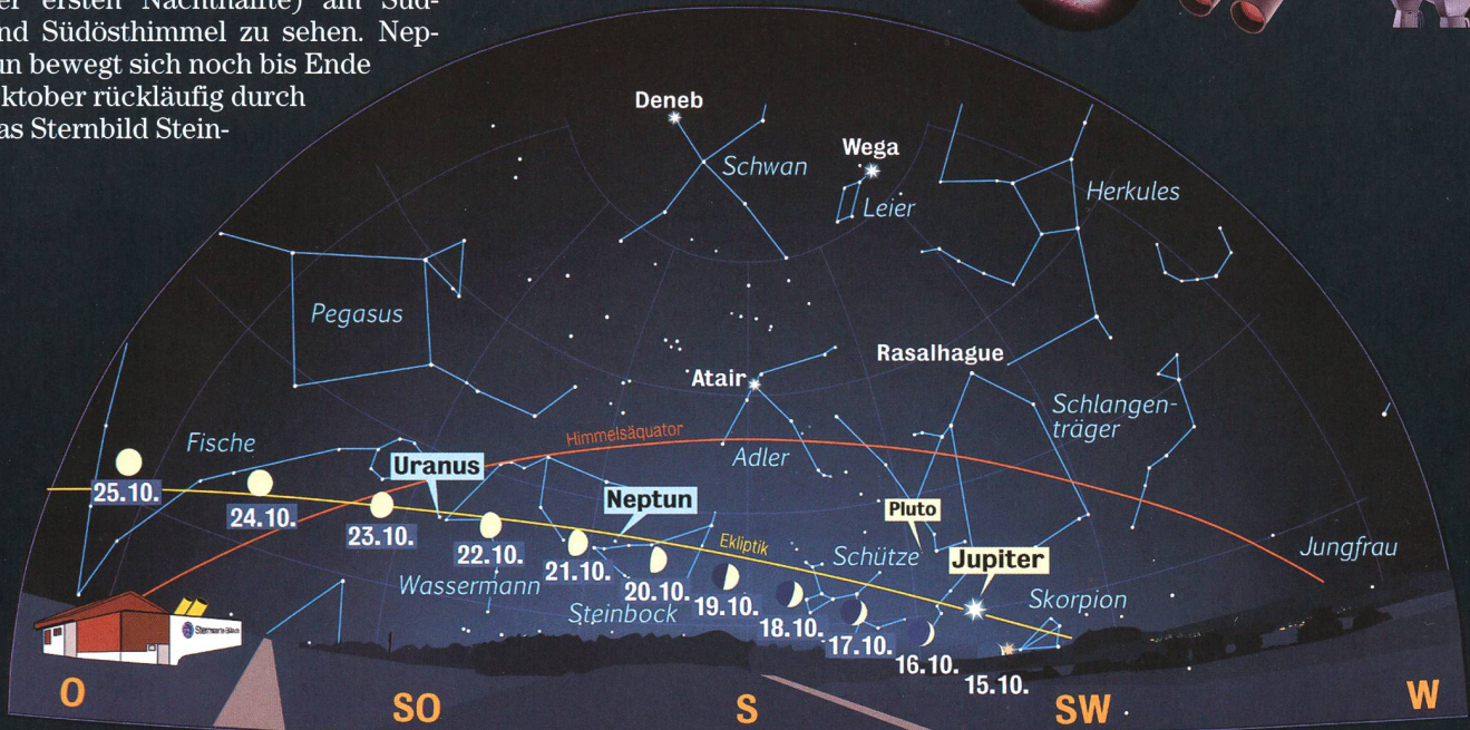
Anblick des abendlichen Sternenhimmels Mitte Oktober 2007 gegen 19.45 Uhr MEZ (Standort: Sternwarte Büllach)