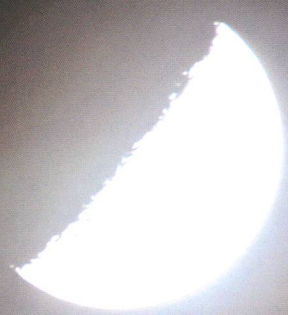
Die Plejadenbedeckung vom 23./24. Februar 2007 konnte bei idealen Bedingungen kurz nach Mitternacht beobachtet werden.

Früh aus Federn heisst es am 7. August 2007, wer die schöne Plejaden-Bedeckung durch den abnehmenden Sichelmond nicht verpassen will. Das himmlische Schauspiel beginnt gegen 2 Uhr MESZ und dauert rund anderthalb Stunden.