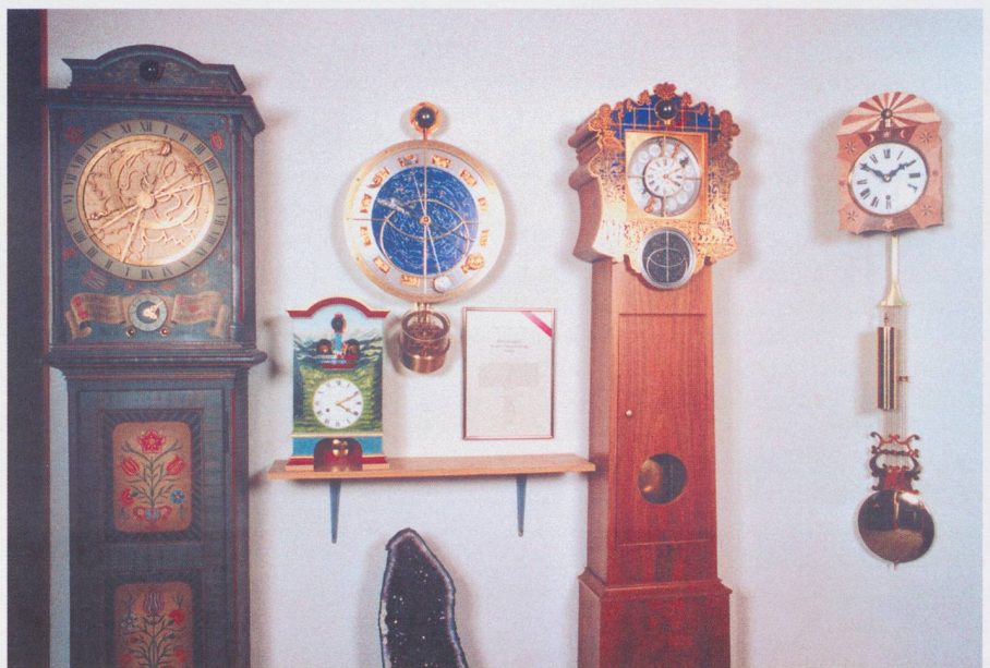
Fig. 3. Die Uhr mit weiteren astronomischen Uhren, wie sie zur Feier, 150 Jahre Uhren ANDEREGG in Nesslau, besichtigt werden konnte. Aus Anlass zu diesem Jubiläum war die neueste von WERNER ANDEREGG gebaute astronomische Uhr Gegenstand eines Wettbewerbs, bei dem sieben der zehn Holzarten zu bestimmen waren, die für das Gehäuse verwendet wurden. Als Stichfrage musste die Anzahl der Zähne der zahlreichen Räder geschätzt werden, die für die astronomische Uhr gefräst werden mussten.

Mit «obsigend» bzw. «nidsigend» wird der aufsteigende bzw. der absteigende Mond bezeichnet. Was die Sonne in einem Jahr vom Tiefststand am kürzesten Tag bis zum Höchststand am längsten Tag und erneuten Tiefststand im Dezember vollführt, schafft der Mond monatlich einmal. «Obsigend» bzw. «nidsigend» hat also nichts mit den Mondphasen und selbstverständlich auch nichts mit dem auf- und untergehenden Mond zu tun. Es gibt Bauern, die das Ausbringen der Saat nach dem auf- und absteigenden Mond ausrich-