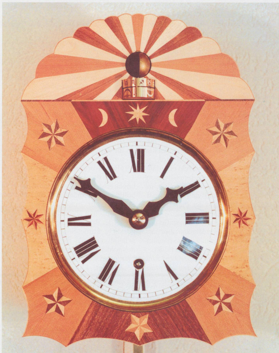
Fig. 1. Die Front mit dem römischen Zifferblatt und der astronomischen Monduhr. Auf der Monduhr können die Mondphasen, der Lauf des Mondes durch den Tierkreis sowie der «obsigende» bzw. der «nidsigende» Mond abgelesen werden. Zu sehen sind ferner die Intarsien, die Sonne, Mond und Sterne darstellen. Die obere Umrandung des Zifferblattes steht für das einem Beobachter abgeflacht erscheinende Himmelsgewölbe; der untere Teil (unter der Trennlinie) ist ein Sinnbild für den durch Berge, Hügel und Täler begrenzten natürlichen Horizont.

Diesen Vorschlag nahm ich zuerst nur als spontane unverbindliche Äusserung zur Kenntnis, in der Annahme,