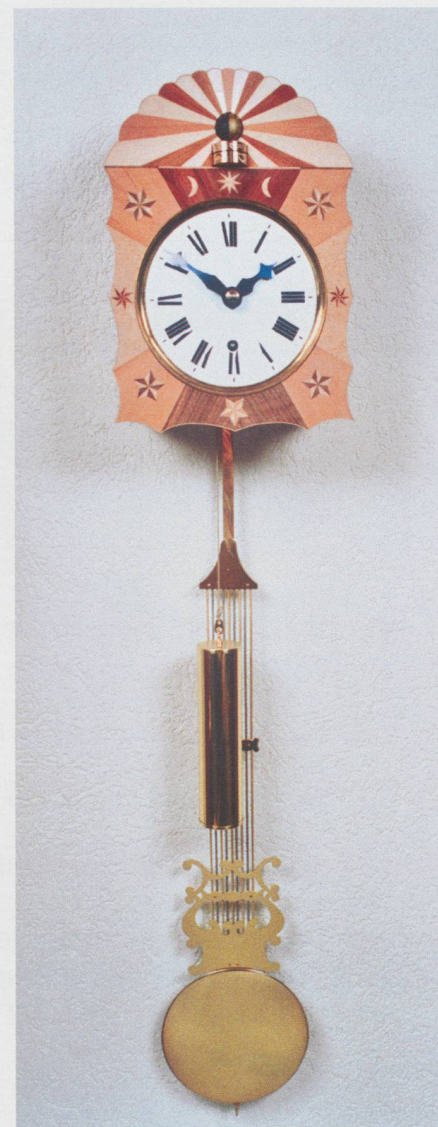
Fig. 2. Ansicht der ganzen Uhr mit Pendel und Gewicht für den Antrieb der Uhr.