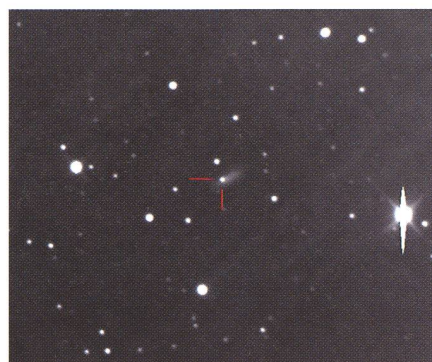
Cette photographie de la supernova «2003lb» a été prise le 29 décembre 2003 avec le «Télescope Bernard Comte» de 610 mm et une caméra CCD FLI Maxcam CM2-1 (pose de 600 secondes sans filtre).

La circulaire IAUC 8260, publiée par le CBAT le 29 décembre suivant, précise la nature et le type de la supernova