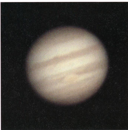
11-03-2003; Maksutov 300/4800; WebCam Vesta Pro-Auflösung 640x480 Pixel; Kombination von 41 AVI-Frames; Bearbeitung Astrostack und Picture Window 2.5; Aufnahmeort Muzzano/TI; 300x268 pixel; 0.268 MB.