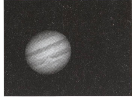
Muzzano, 27-02-03. Telescopio Maksutov-Cassegrain 300/4800; WebCam Vesta Pro; Media di 74 frames selezionate da un video di 20 secondi, 30 frames al secondo; Modo in bianco-nero; Elaborazione con Astrostack 2 e Picture Window; 320x303 pixel; 0.291 MB.