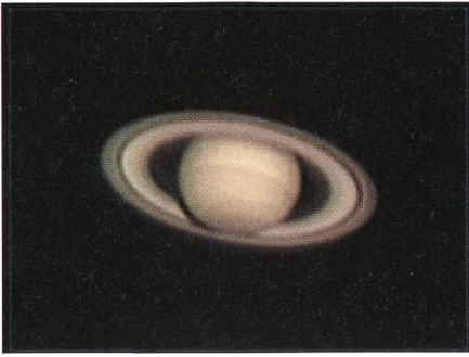
Teleskop Maksutov 300/4800; Web Cam Philips Vesta Pro, Auflösung 640x480 Pixel; Bearbeitung von ca 540 AVI Frames mit Astrostack und Picture Windows; Muzzano, Aufnahme 18-03-03.