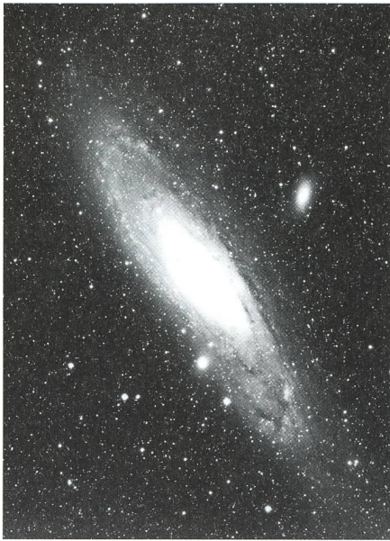
Bild 1: Der Andromedanebel M 31 mit den Satellitengalaxien M 32 und NGC 205.

Weil diese Übersichtsaufnahme schon im letzten Jahresbericht abgedruckt wurde folgt als Bild 2 noch ein vergrößerter Ausschnitt vom Zentrum von M 31 zu NGC 205. Man beachte dabei in den Randpartien von M 31 die komplizierten Strukturen der dunklen Staubwolken vor dem dahinter liegenden hellen Spiralarm.