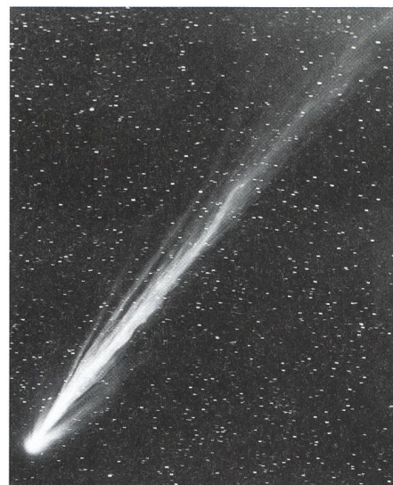
La comète Morehouse 1908 III.

Et il en était ainsi à reculer lorsqu'il sentit un pied, puis l'autre, se dérober et une gangue humide lui monter le long des jambes. Il venait de pénétrer dans l'un de ces multiples marécages fagnards. Sa réaction instinctive fut de