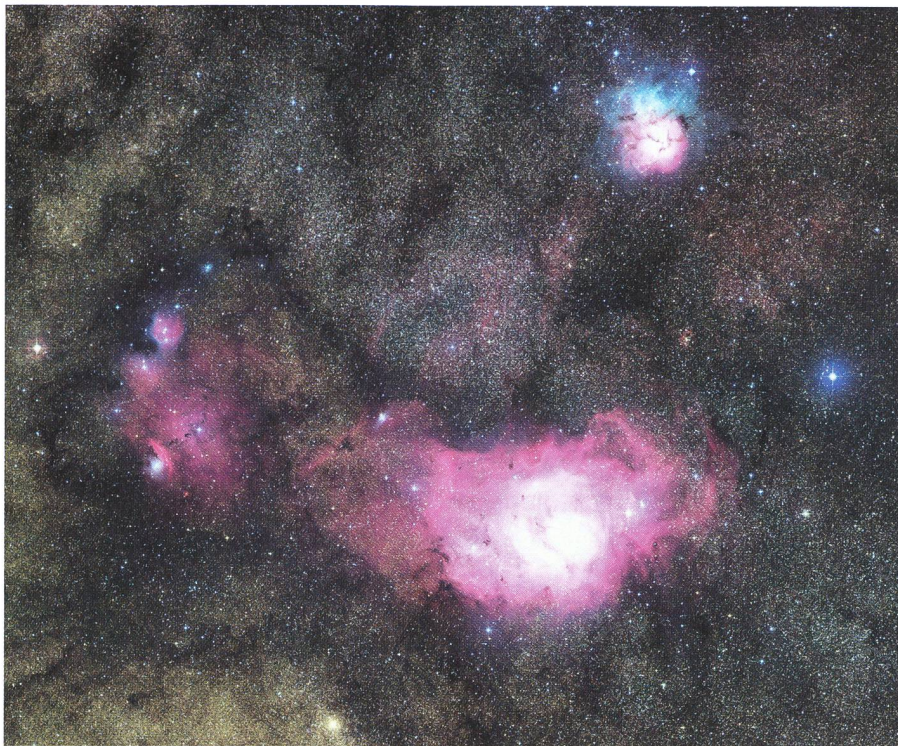
Fig. 2: Die Milchstrassenregion um den Trifidnebel (M8) und den Lagunennebel (M20).

GIACOMETTI'S Umgang mit den Farben erstaunt umso mehr, als zur damaligen Zeit keine direkte Darstellung der Himmelsfarben möglich war, wie man sich das heute gewöhnt ist. Seine Grabinsschrift trifft denn auch ins Schwarze: «Meister der Farben».