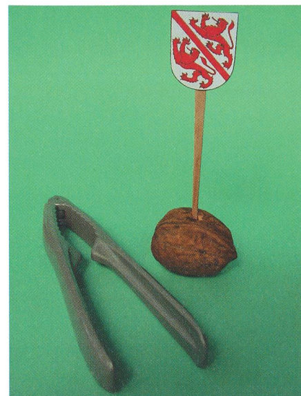
Fig. 2: Geschenke für den Winterthurer Stadtpräsidenten: Eine Baumnuß als Symbol für den Asteroiden. Dazu ein Nussknacker, um das Problem zu lösen, die 8000 himmlischen Hektaren ins städtische Liegenschaften-Portfolio einzubinden ...

Mit jeder einzelnen dieser vorgängigen Sichtungen und mit den zusätzlichen Beobachtungen GRIESSERS stieg die Bahngenauigkeit des neuen Himmelskörpers, was das Minor Planet Center bereits am 25. Juni zur Zuteilung einer definitiven Nummer veranlasste. Aus der provisorischen Bezeichnung 2002 GA10 entstand so der Kleinplanet Nr. 43669, der dank der genauen Bahnbestimmung nun nie mehr verloren gehen