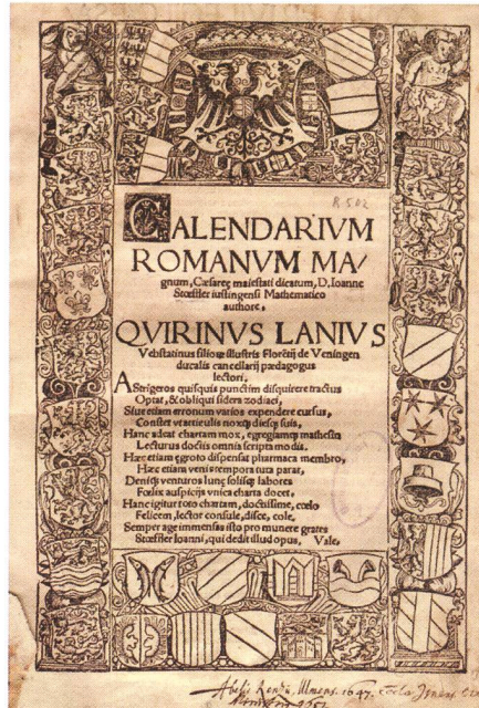
Page de titre du Calendarium Romanum Magnum de STÖFFLER (1518).

Revenons à ce vieil ouvrage. D'un format un peu plus petit que l'A4, ce livre est nettement plus léger que nos bouquins actuels du même nombre de pages (environ 300), résultant en fait d'une toute autre qualité de papier. Sa couverture brune, sale et vermoulue, pousse à le manipuler avec grande précaution.