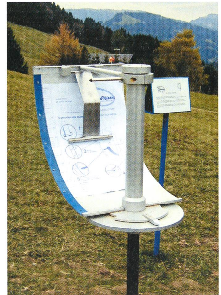
Le quadrant solaire. Der Sonnen-Quadrant.

Observatoire de Genève, CH-1290 Sauverny