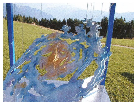
Notre galaxie: la voie lactée.

Le parcours est jalonné d'écrêteaux en français et en allemand. Mais si le visiteur veut dépasser le niveau du simple curieux, nous lui recommandons d'acheter pour le prix modique de fr. 4.- le Guide du Parcours Claude Nicollier . Cette brochure le conduira pas à pas, elle l'invitera à procéder à des observations et à des manipulations simples; elle l'aidera aussi à se poser les bonnes questions. On peut la trouver à l'entrée du parcours, au restaurant des Pléiades et à la gare de Blonay.