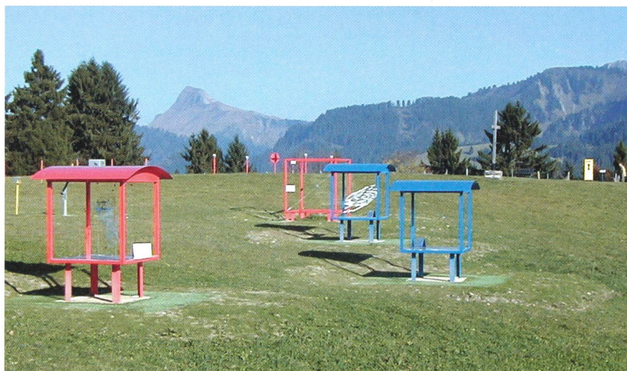
Vue d'ensemble du site.

Une idée originale de ce parcours est qu'on s'y réfère toujours à une même base sur le terrain: la distance entre les Pléiades et un sommet bien connu des Alpes de Savoie, le Grammont, distant de 15,6 km. En passant d'une station à l'autre, on change d'échelle. Un triple saut astronomique transporte le visiteur, des prairies de notre environne-