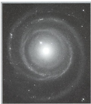
Hubble enthüllt «rückwärts drehende» Spiralgalaxie - 11