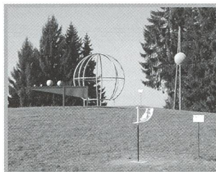
Astropleiades - Une initiation à l'astronomie originale - 29