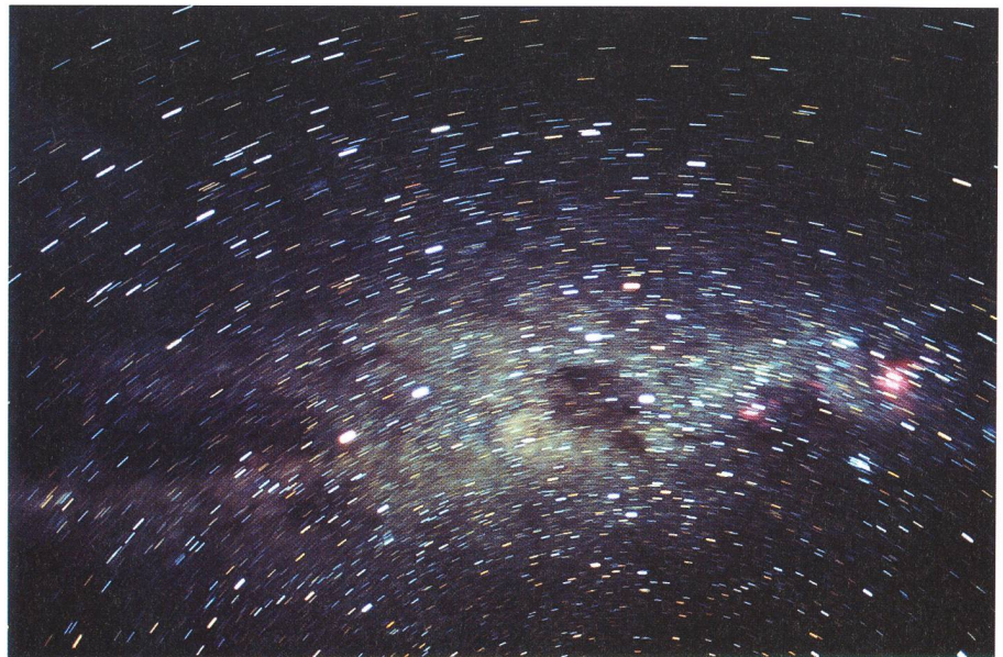
Fig. 2: Livingston, Sambesi, 17. Juni 2001, 19:09 bis 19:14 Uhr, Blende 2. Durch die Öffnung der Blende sind auch schwächste Sterne sowie die Milchstrasse erkennbar.