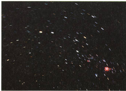
Fig. 1: Livingston, Sambesi, 16. Juni 2001, 21:24 bis 21:29 Uhr, Kodak Ektachrom 200 Professional, Nikon F-301, 35 mm Objektiv, Blende 5,6. Die beiden hellen Sterne (links Rigil, d.h. \alpha Centauri, nächster Fixstern der Erde, rechts \beta Centauri) 4 werden «Pointers» genannt. Sie zeigen auf das Kreuz des Südens, das mit dem weissen \alpha im Süden und dem orangen \gamma Crucis im Norden leicht zu erkennen ist. Rotes Gebilde rechts: siehe Text.

Während der totalen Sonnenfinsternis vom 11. August 1999 hatte ich folgenden Plan: Ab erstem Kontakt würde ich die fortschreitende Sonnenbedeckung mit einem 600 mm Objektiv aufnehmen. Während der Totalität wollte ich ein 35 mm Objektiv offen lassen, um die Dynamik der totalen Eclipse mit ihrer Umgebung festzuhalten. Das Wetter verhinderte dieses Experiment [1]. So beschlossen wir im Juni 2001 nach Sambia zu reisen, um diesen Versuch erneut durchzuführen. Wer hat schon je Merkur, Venus, Jupiter und Saturn sowie die Zwillinge und den Orion neben der Sonne fotografiert? So wird sich die Umgebung der Sonnenfinsternis am 21. Juni 2001 präsentieren [2]. Am 15. Juni reisten wir via Johannesburg an die Victoria-Fälle. Am Ufer des Sambesi waren die Nächte wunderbar klar, kühl zwar, bis 8 Grad. Der kürzeste Tag auf der südlichen Halbkugel stand kurz bevor. Keine Lichtverschmutzung störte den Blick auf den südlichen Sternenhimmel.