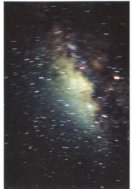
Fig. 3: Livingston, Sambesi, 17. Juni 2001, 21:42 bis 21:47 Uhr, Blende 2. Blick ins Zentrum unseres Milchstrassensystems im Sternbild des Schützen. Rechts im Bild der Planet Mars.

Am 19. Juni gings dann weiter von Livingston am Sambesi in den Nordkafue Nationalpark, im Norden Sambias. Unserem Pilot der zweimotorigen Cessna mit 6 Passagieren (übrigens sämtliche Flugzeuge waren wegen der Sonnenfinsternis ausgebucht; an die besten Orte des Totalitätsgürtels konnte man nur via Buschfliegerei gelangen) dräng-