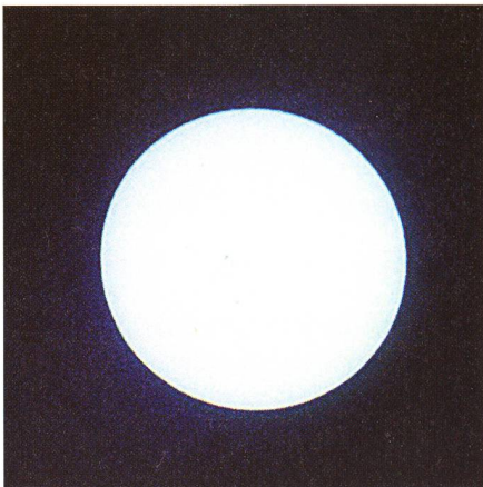
Fig. 5: Ntemwa-Lager am Lufupu-Fluss, Kafue National Park North, 20. Juni 2001, 600 mm; Sonnenflecken.