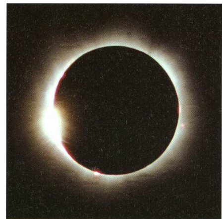
Der 2. Kontakt erfolgt. Der letzte Sonnenstrahl entschwindet am 11. August 1999 über Pecöl, Ungarn durch ein Mondtal. Bereits taucht um den Neumond herum die Korona auf.

Die totale Sonnenfinsternis nimmt ihren Anfang jenseits des Südatlantiks, rund 400 km südöstlich vor der Küste Urugays auf der Höhe der Mündung des Rio de la Plata. Dort trifft der Kernschatten des Mondes um 12:36 Uhr MESZ auf einer Breite von 127 km erstmals auf die Erdoberfläche. Schon geraume Zeit vorher ist von Teilen Lateinamerikas aus bei Sonnenaufgang eine partielle Sonnenfinsternis zu beobachten. In den folgenden 2 Stunden überquert der Schatten in weitem Bogen den südlichen Atlantik. Noch bevor die mittlerweile 200 km breite Kernschattenellipse auf die Südwestküste Afrikas trifft, wird draussen im Ozean mit einer Dauer von 4 Minuten und 56 Sekunden die längste Totalität erreicht. Damit reiht sich diese Finsternis des Saros 127 in die Liste der längeren ihrer Art ein. Maximal wäre eine Totalitätsdauer von 7 Minuten 31 Sekunden möglich. Doch wird diese magische Grenze im Zeitraum zwischen 3000 v. Chr. bis 3000 n. Chr. gar nie erreicht, weil unzählige Faktoren wie Abstandsverhältnisse zwischen Sonne und Erde, Erde und Mond,