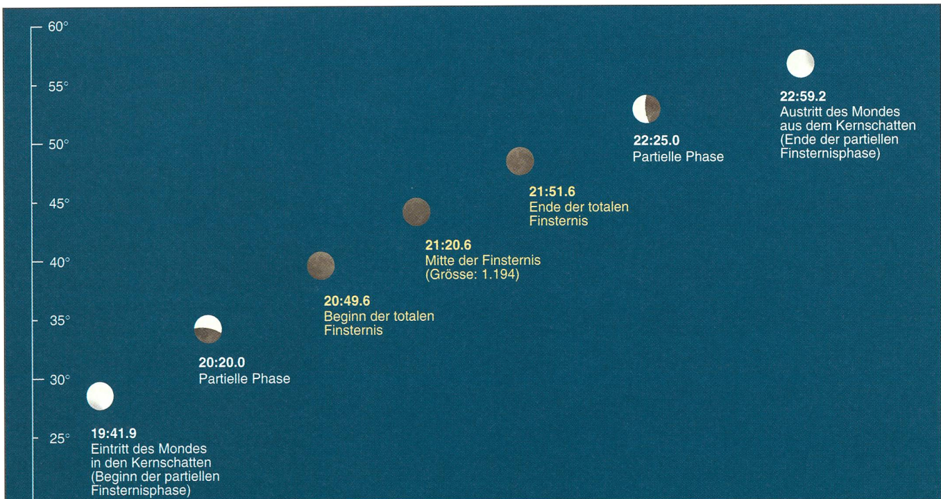
Fig. 2: Die Darstellung zeigt den Verlauf der totalen Mondfinsternis am Abend des 9. Januar 2001, wie sie ein Beobachter von der Schweiz aus über dem Südosthorizont erlebt. Der Vollmond zu verschiedenen Zeitpunkten der Finsternis gezeichnet. Kurz vor und nach der Kernschattenphase wird man auf der Mondscheibe für eine Weile die inneren Bereiche des diffusen Halbschattens ausmachen können. (Grafik: THOMAS BAER)

N bedeutet: Vollmond durchläuft den nördlichen Bereich des Kernschattens S bedeutet: Vollmond durchläuft die südliche Kernschattenzone