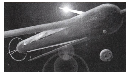
Le cylindre d'O'Neill.

La navette lunaire venait de dépasser la ceinture géostationnaire en se faufilant dans un des couloirs réservés. Car non seulement, c'était peuplé en bas, mais aussi ci-haut! Certes, cela ne s'était