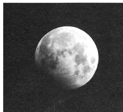
Fig. 2. Von der fast partiellen Mondfinsternis am 7. Oktober 1987 gibt es nur wenige Aufnahmen. Eine gelang dem Autor ziemlich genau um die Finsternismitte. Rechtzeitig auf den Höhepunkt riss die Wolkendecke auf und liess während etwa zwanzig Minuten sehr klare Blicke auf den düsteren Vollmond zu.

chenvorschrift für den geometrischen Kernschattenrand fiel die Finsternis mit einer Grösse von 0.01% tatsächlich partiell aus. Jedenfalls war die Verdunkelung durch den Erdhalbschatten, wie Fig. 2 veranschaulicht, so augenfällig, dass sie sogar einem flüchtigen Beobachter aufgefallen wäre.