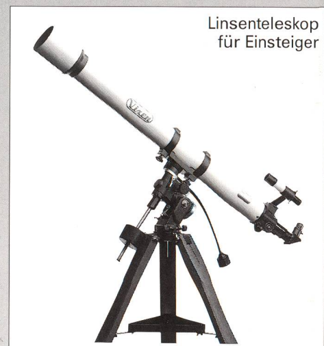
Linsenteleskop für Einsteiger