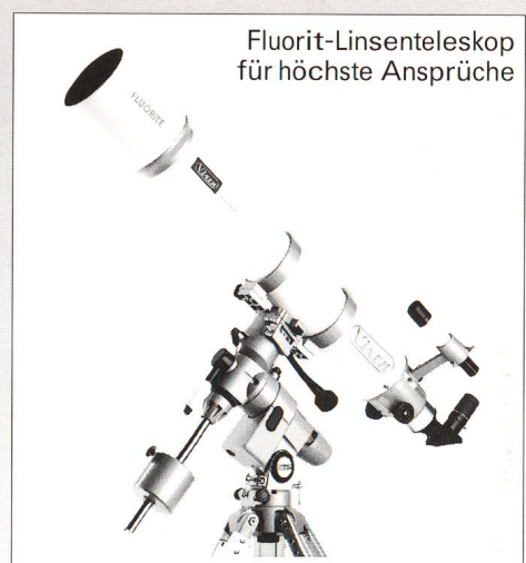
Fluorit-Linsenteleskop für höchste Ansprüche