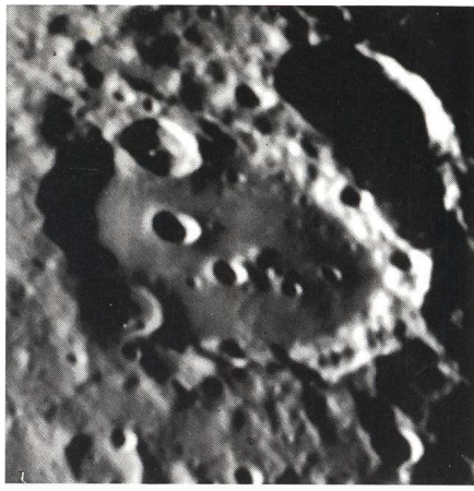
Mondkrater Clavius, fotografiert mit Vixen FL-80 S

Die Vixen-Erfolgsformel für Freude an der Astronomie