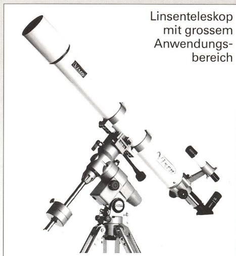
Linsenteleskop mit grossem Anwendungsbereich