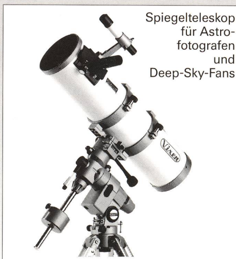
Spiegelteleskop für Astrofotografen und Deep-Sky-Fans