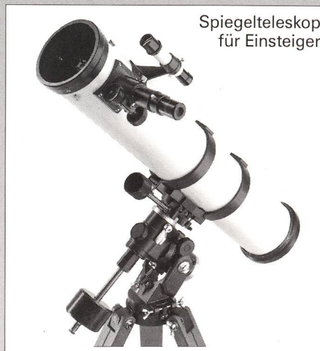
Spiegelteleskop für Einsteiger