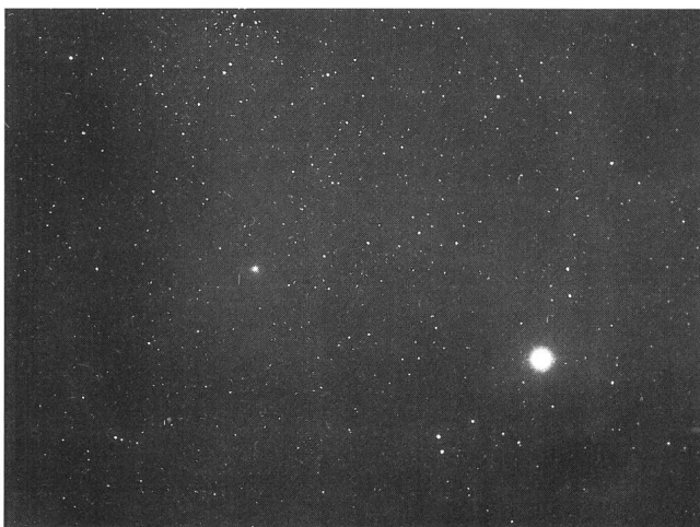
Photo prise à Bâle le 1 er avril 1994 à partir de 2047 UT; temps de pose 3 1/2 min sur TP 2415 hypersens.; caméra Schmidt (Celestron) de 5.5". Position de la comète à l'est de Aldebaran et au sud de NGC 1647, AR 4h 45m l, D +17°16' (2000).

D R URS STRAUMANN Oscar Frey-Str. 6, 4059 Basel