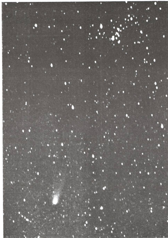
Comète BRADFIELD (1987s) - 17.10.87 -90 sec. sur TP 2415/H. Caméra de Schmidt 1.5/300. Copié sur AGFA ORTHO 25, agrandi sur papier Kodak TPP5.