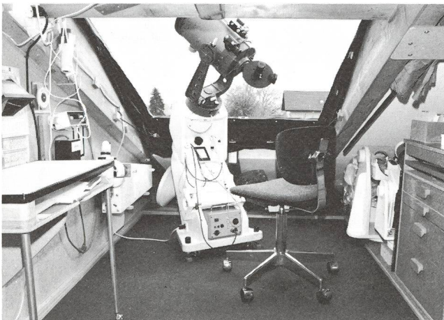
Innenansicht der Beobachtungsstation mit der selben Montierung. Ganz links im Bild ist ein dreibeiniger Rolltisch zu sehen, der unmittelbar an die Montierung für das Zeichnen am Okular herangezogen werden kann.

Die Umgebungstemperatur-Unterschiede sind für das «Seeing» wichtig. Es ist erstaunlich, wie schnell sich die Dach-