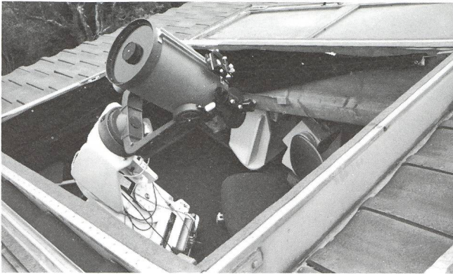
Ansicht der offenen Dachlücke von aussen mit Celestron 8 auf der in der ORION-Nr. 193 beschriebenen und seither erweiterten Montierung. Am Rahmen der Oeffnung befestigt erkennt man ein schwarzes Tuch, das durch ein Gestänge gespannt als Vorhang aufgerichtet werden kann. Es schützt gegen Wind und vorallem gegen Lichter der Umgebung.

Ein im Masstab 1 : 10 gefertigtes Modell erleichterte die Projektierung einer durch zwei Türflügel, wettersicher abschliessbaren Dachlücke. Die Grösse und Höhe der Oeffnung wurde durch das Gewicht der beiden mit verzinktem Eisenblech belegten Türen, die ein nicht zu mühsames Oeffnen und Schliessen gewährleisten sollten, bestimmt. Zwei Dachbalkenzwischenräume ergaben die Breite von 1,2 m und die Länge wurde mit 1,55 m bemessen. Ein knapper Beobachtungsplatz, aber genügend gross für eine Person, mit ringsum bequem erreichbarem Zubehör.