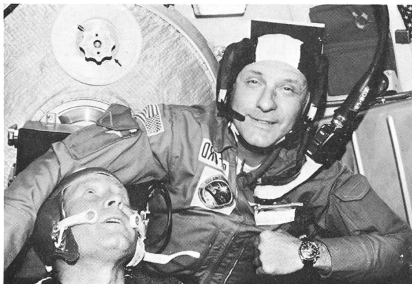
Bild 1: TH. P. STAFFORD und A. A. LEONOV bei Ihrem Zusammentreffen in der Soyuz-Raumkapsel.

besuchen und Geschenke austauschen konnten. Hierzu hatte die NASA die Entwicklung und Herstellung des Kopplungsteils übernommen. Bei der Ausführung dieses Raumfluges übernahm zudem die Apollo-Crew auf Grund der besseren Manövrierfähigkeit der Apollo-Kapsel die Ausführung des Docking-Manövers, also den An- und Wiederabkoppeln der beiden Raumschiffe. Den glatten, fast auf die Sekunde mit dem Terminplan übereinstimmenden Verlauf dieses Unternehmens von den beiden Starts bis zu den beiden Landungen konnten Millionen von Fernsehzuschauern auf ihren Bildschirmen verfolgen. Von den vielen Photos, die anlässlich dieses letzten Apollo-Fluges gemacht wurden, konnte die ORION-Redaktion dank dem Entgegenkommen der NASA ein Bild der beiden Raumschiff-Kommandanten STAFFORD und LEONOV bei ihrem Zusammentreffen in der Soyuz-Raumkapsel, sowie je ein Bild vom Start und von der Landung des Apollo-Raumschiffs zum Abdruck erhalten. Diese Aufnahmen dokumentieren den Abschluss einer etwa 10-jährigen Raumfahrts-Periode, deren Höhepunkte die Apollo-Lem-Unternehmungen mit Landungen auf dem Erdtrabanten waren, und die nun durch den Einsatz wiederverwendbarer Space Shuttles, neuer Raumflugzeuge von der Grösse eines mittleren Verkehrsflugzeugs, abgelöst werden sollen.