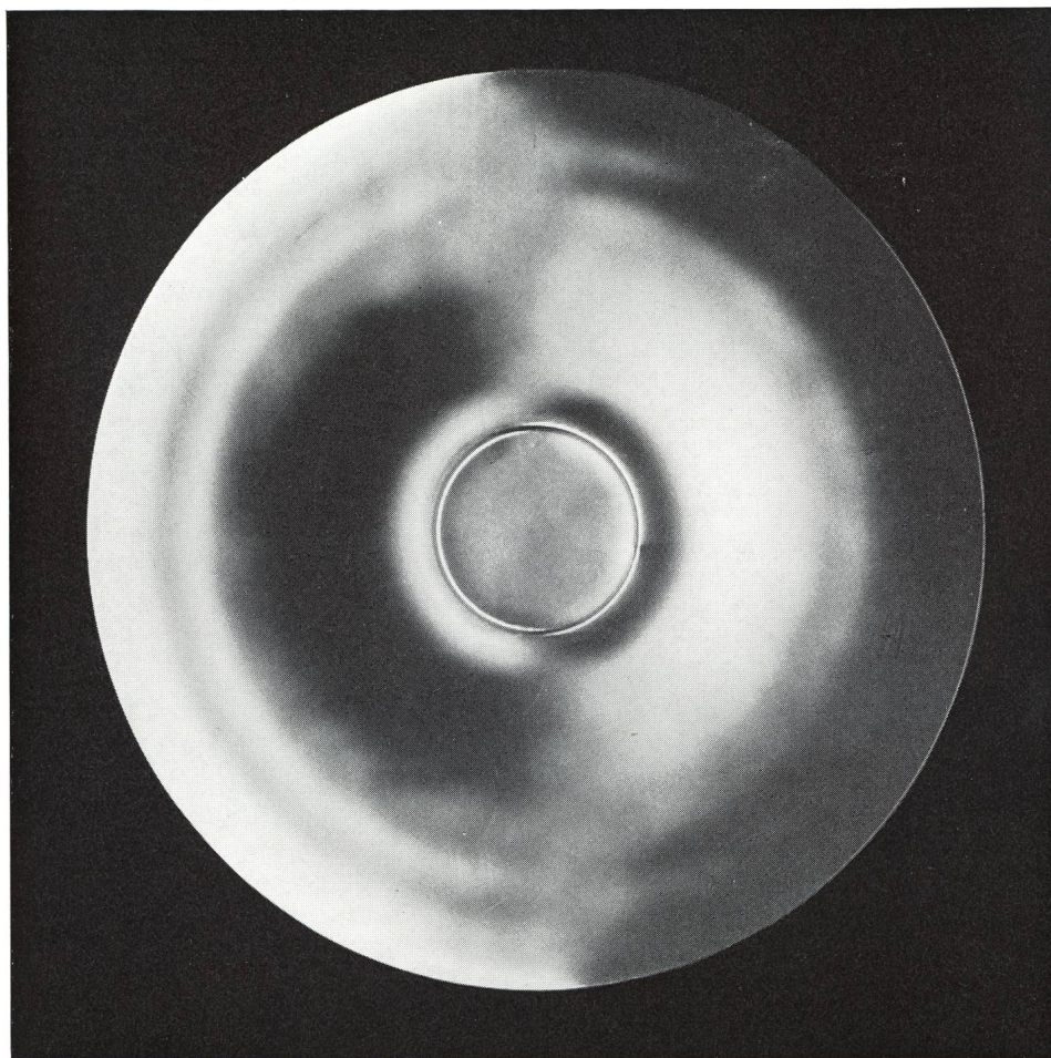
Fig. 3: Das erste FOUCAULT-Bild des 800 mm-Spiegels. Deutung dieses Bildes: siehe Text.

Bohrung etwa 1 \lambda vom Sollwert abweicht. Die endgültige Figur des Spiegels wird ähnlich aussehen, jedoch eine etwa 10 mal grössere Abweichung von der Kugelform haben. Bis diese Figur erreicht sein wird, sollten erfahrungsgemäss auch die Ringzonen und die Wolkenstruktur verschwunden sein. Im übrigen hoffe ich, in etwa einem halben Jahr an dieser Stelle einige Bilder des fertigen Instruments mit der auskorrigierten Optik 1) veröffentlichen zu können.