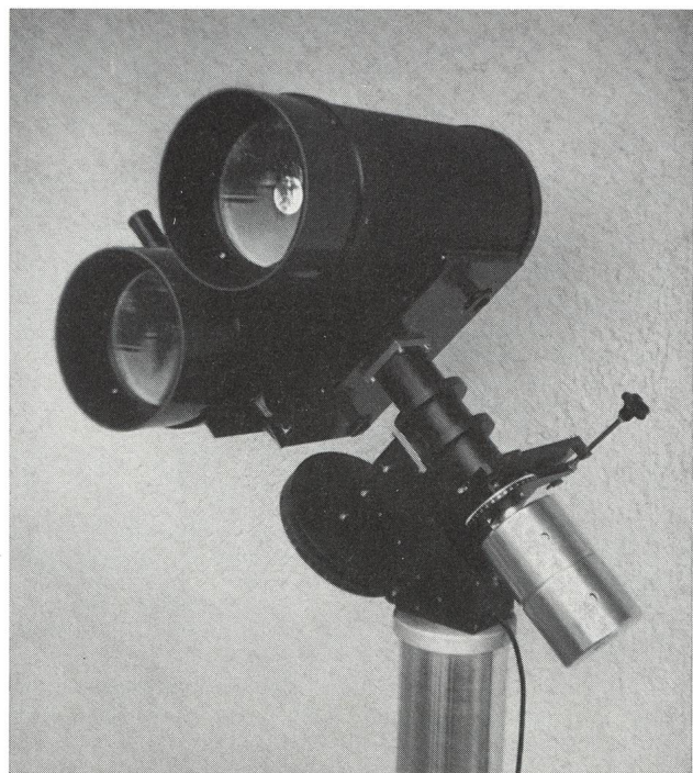
MAKSUTOW-Doppel-Teleskop 200/500 mm und 3200 mm

Beratung und Vorführung gerne und unverbindlich!