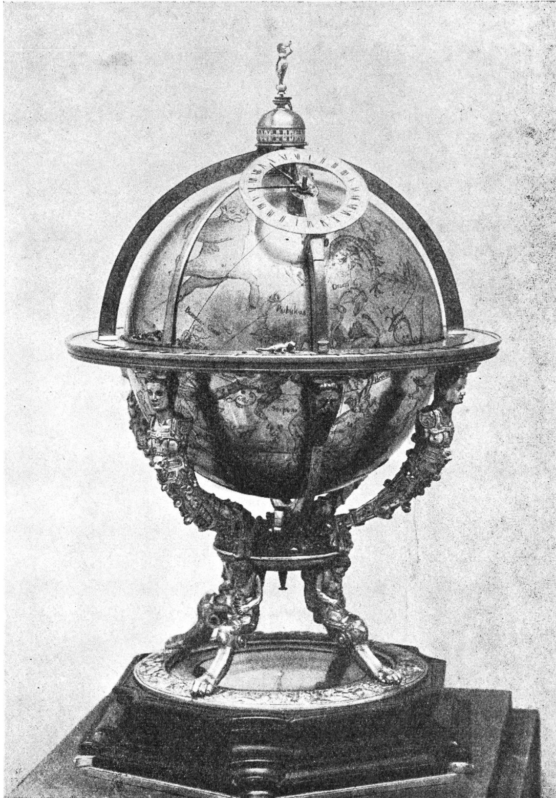
Himmelsglobus mit eingravierten Sternbildern. Er wird durch ein in seinem Innern befindliches Uhrwerk in 24 Stunden einmal um seine Achse gedreht. (Museum in Kassel.)