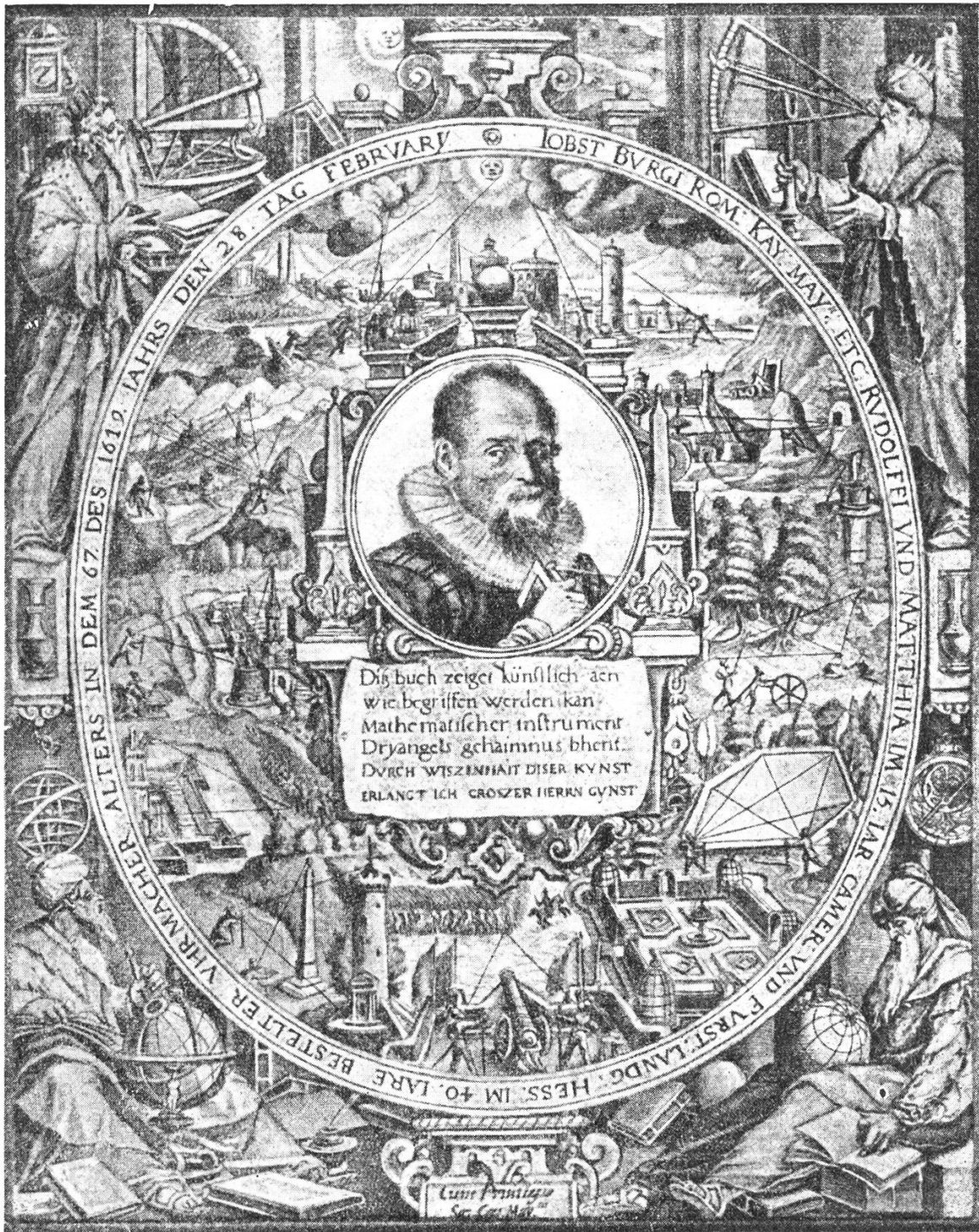
Titelbild zur Gebrauchsanweisung des Triangular-Instruments, mit dem einzigen Bildnis von Bürgi, das er 1619, an seinem 67. Geburtstage, in Kupfer stechen liess. Die Veröffentlichung der Gebrauchsanweisung geschah erst 1648, also 16 Jahre nach dem Tode Bürgis, durch seinen Schwager Benjamin Bramer. (Das seltene Werk befindet sich auch in der Bibliothek des Toggenburger Heimatmuseums in Lichtensteig.)