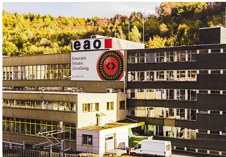
Vom Kleinstbetrieb zu einer der führenden Solothurner Industriefirmen: Die Oltner EAO AG erhielt den Solothurner Unternehmerpreis 2018.