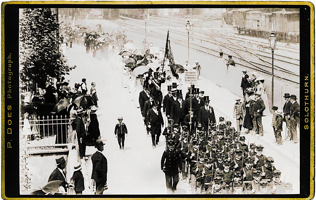
Das Oltner Schulfest im Jubeljahr 600 Jahre Eidgenossenschaft 1891

Was nun die Festpostkarten angeht, ist grundsätzlich zu sagen: Im Gegensatz zu den Ansichtspostkarten, deren älteste bis in die Mitte des 19. Jahrhunderts zurückreichen, kommen eigentliche Festpostkarten – in der Regel sind es Karten, die auf irgend ein bevorstehendes Fest hinweisen – eigentlich erst ab dem frühen 20. Jahrhundert in Gebrauch. Ältere Aufnahmen von Festanlässen sind in der Regel Aufnahmen, die eher zufällig als Fotografien in den Alben von Fotosammlern auf uns gekommen sind. Eigentliche Postkarten dieser Art aus der Pionierzeit dürften denn auch extrem selten sein. Erinnerungsfotos, oder sagen wir besser Erinnerungsbilder, von wichtigen, politischen oder kulturellen Anlässen hingegen sind gar nicht so selten. So hat zum Beispiel Martin Disteli den Waldgang der Forstkommission Olten 11 als so wichtig empfunden, dass er ihn in einem Bild festgehalten hat. Auch der «Volkstag von Balsthal, vom 22. Dezember 1831» von dem der Winznauer Maler Joachim Senn auf seiner Lithographie just den «Moment» eingefangen hat, in dem Josef Munzinger verlangte, «die Souveränität des Volkes soll ohne Rückhalt ausgesprochen werden», dürfte im 19. Jahrhundert in vielen Wohnungen fortschrittlich oder freisinnig gesinnter Kampfgenossen gehangen haben. Ein Grossteil der als Postkarten von Grossanlässen erhaltenen Ansichten sind denn wohl auch als eigentliche «Erinnerungsbilder» zu betrachten.