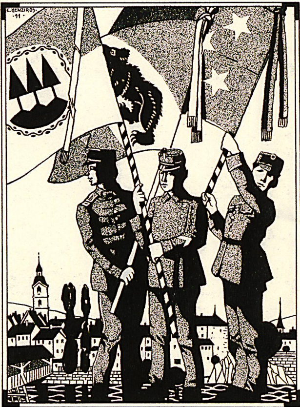
Kadetten-Tag in Olten September 1911.