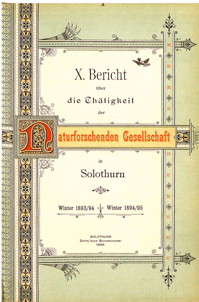
Abb. 1: 10. Tätigkeitsbericht, 1893/94 – 1894/95

herausgegeben. Mit der Saison 1878/79, zu Beginn einer Periode des Aufschwungs mit rasch steigender Mitgliederzahl, nahm man die Publikation wieder auf. In den Tätigkeitsberichten «wurden die Vorträge in einer