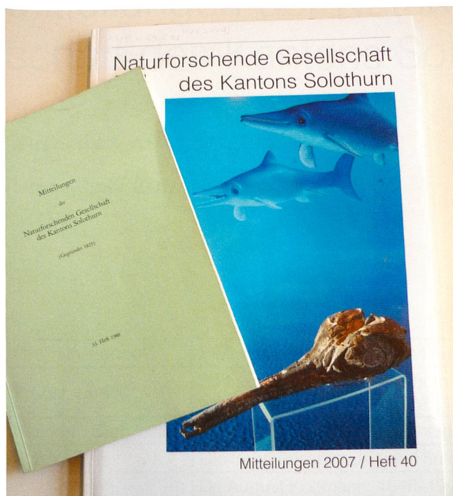
Abb. 4: «Mitteilungen» im alten und im neuen Format

das Wort «in» entfernt, ab 1963 erscheint der Kanton Solothurn im Titel. Im 29. Heft von 1980 findet sich ein Inhaltsverzeichnis für die Hefte 1 bis 28.