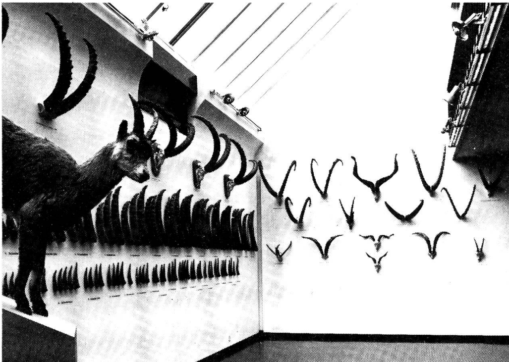
Neben interessanten Text- und Fototafeln zeigte die Sonderausstellung « Der Steinbock » eine grosse Vielfalt in- und ausländischer Steinbocktrophäen.

Einmal mehr lieferte das Naturhistorische Museum Bern den Grundstock einer Ausstellung, nämlich 30 Bildtafeln zum Thema « Der Steinbock ». Diese Ausstellung wurde durch zahlreiche Objekte ergänzt. Eine Trophäenwand mit 60 Einzelhörnern zeigte die Altersentwicklung und die individuelle Variabilität der Steinbockgehörne auf. Zu Vergleichszwecken wurden auch zahlreiche Gehörne ausländischer Steinbockarten sowie Gehörne aus der Zeit vor der Ausrottung des Alpensteinbocks in der Schweiz ausgestellt. Der Film « Der Steinbock » des Zoologischen Museums Zürich wurde 145mal vorgeführt. Die Steinbockausstellung wurde in einer etwas reduzierten Form vom 9. bis 21. August 1982 in der Chesa Planta in Samedan gezeigt.