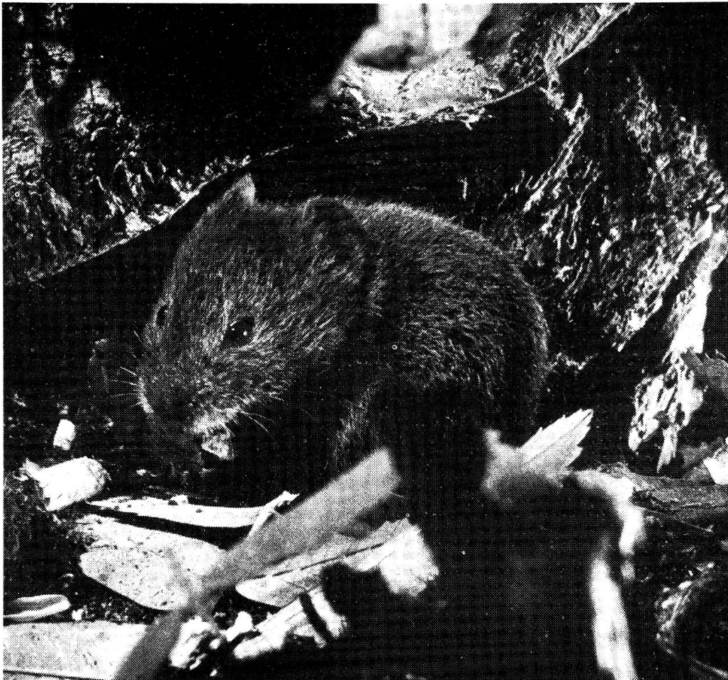
Rötelmäuse werden im Terrarium ausserordentlich zutraulich. Wer sie beobachtet, merkt bald, dass auch Mäuse schön und sauber sind.

Die Literaturaufgaben mit populärwissenschaftlichen Broschüren, Büchern und Zeitschriften stiessen auf ein lebhaftes Interesse. Daher wurde die Leseecke im 1. Stock umgebaut und erweitert. Eine gemütliche Sitzgruppe dient auch der Erholung der ermüdeten Museumsbesucher.