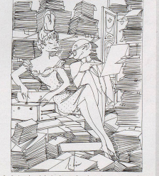
Der Papierwettbewerb der Bundesverwaltung bringt im vergangenem Jahr 1965 Kosten, das sind 150 Tonnen mehr als im Vorjahr. «Macht mer so den Auffang» - «Der Post, aber mer schuldig Abzug, stellen Logbuch!» - «ich es ist mit zum Papier-Schwarz!» Der Papierwettbewerb der Bundesverwaltung bringt im vergangenem Jahr 1965 Kosten, das sind 150 Tonnen mehr als im Vorjahr. «Macht mer so den Auffang» - «Der Post, aber mer schuldig Abzug, stellen Logbuch!» - «es sich en Unfall zum Papier-Schwarz!» 1965