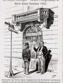
Baumwoll zum Fester: Borer: Hingegit ist me für die Beamten de überpost direktan reuert und darf vom Postamt der Betriebskasse nicht bezahlt werden! (Völl. beamtenverweidlich) 1905