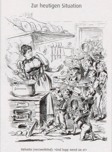
Helvetia (Verzweifelnd), «stund Supp wend sie ein» 1895