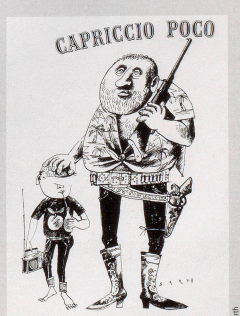
Mit 1965 oder «die Überbrückung» durch italienische Gabelstapler!