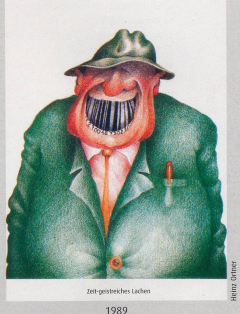
Zeitgeistliches Lachen 1989