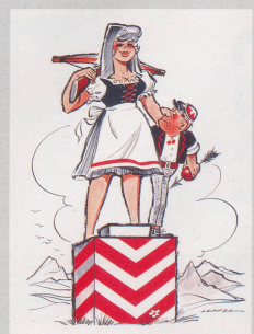
Inmer mehr Schweizerinnen werden Kantonsrätinnen und Kantonsrätinnen.