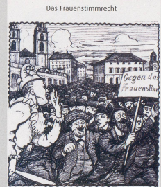
Nebelgaller: «Mit keiner Aufregung, weiser Herr! Ich handelt sich nur um eine Formsache. Unsere Gesetze machen ja ohnehin die Frauenweiser.»

Wolf Buchinger (Text) & Silvan Wegmann (Cartoon)