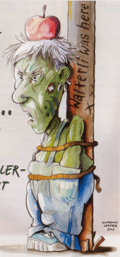
MARKUS URFER 2005