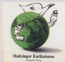
1982 Fr. 19.80