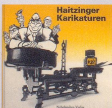
1988 Fr. 19.80