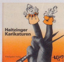
1989 Fr. 19.80