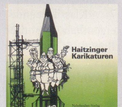
1987 Fr. 19.80