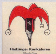
1983 Fr. 19.80