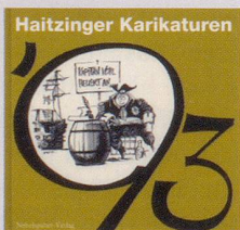
1993 Fr. 19.80