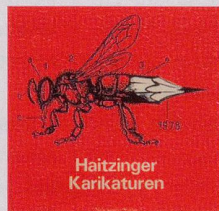
1978 Fr. 19.80