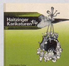
1991 Fr. 19.80