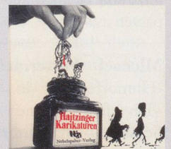
1981 Fr. 19.80