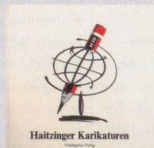
1979 Fr. 19.80