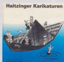
1990 Fr. 19.80