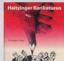
1986 Fr. 19.80