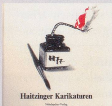
1977 Fr. 19.80

Diese und mehr als 100 weitere «Nebenspalter»-Publikationen können mittels Bestellkarte im «Nebibuchshop» unter www.nebenspalter.ch oder über den Abodienst (Tel. 071 846 88 76) bezogen werden.