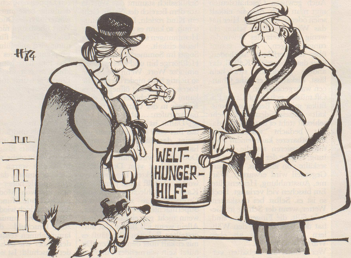
«Ist eine Flickspende auch schon drinnen?»