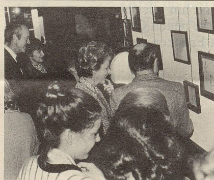
«Druggete» bei der gelungenen Nocturne-Vernissage in der «Minigalerie Münz» des neueröffneten Hotels Basel, wo unser Mitarbeiter Jüsp seine neuesten Schöpfungen noch bis Ende Januar ausstellt.