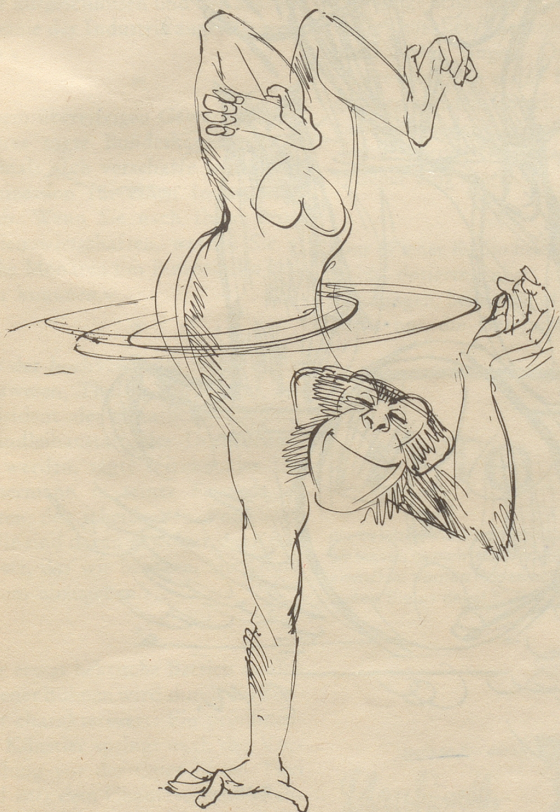
Hier sieht man ihn in neuer Pose – Er hula-hoopt bis zur Psychose.