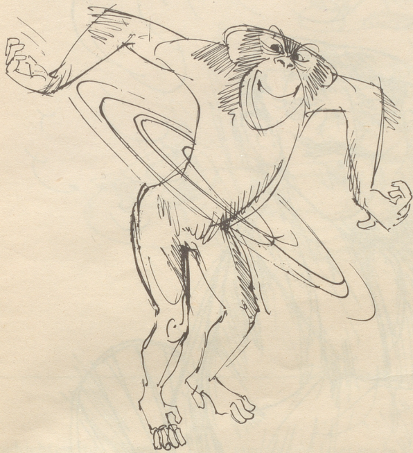
Es kreist der Ring um Miggels Bauch, Es hula-hoopt der Affe auch.