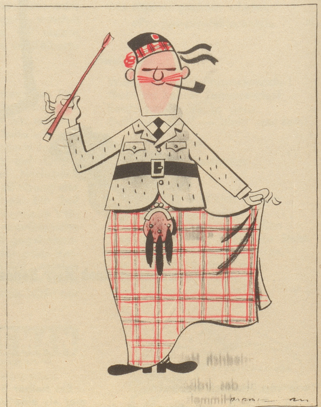
Wird der Schrei der Mode bis nach Schottland dringen?