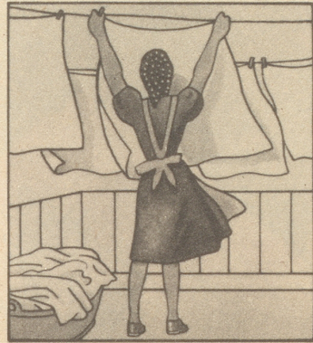
Aber der Wind kühlt sie schnell genug ab.