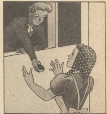
„Bitte nehmen Sie von meinen Gaba. Das ist mein Hausmittel. Gaba schützt vor Husten und Heiserkeit.“