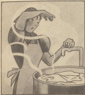
Frau Peter hat große Wäsche, in der Waschküche ist es fast wie im türkischen Dampfbad.