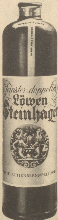
Erste Aktienbrennerei Basel

Die beliebte Gaststätte im Zentrum heute besser denn je Bierlokal, Grill, Café-Restaurant HOTEL WALHALLA St. Gallen