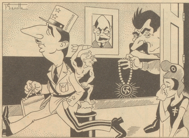
Die Versuchung der Marianne