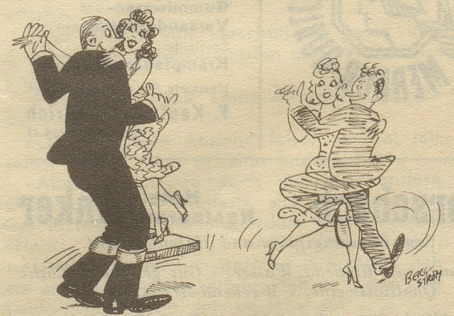
«So kann auch der lange Petterson tanzen.»