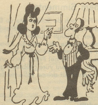
«Was sind das für Manieren, während der Arbeit zu pfeifen?» «Aber Madame, ich pfeife nur.»