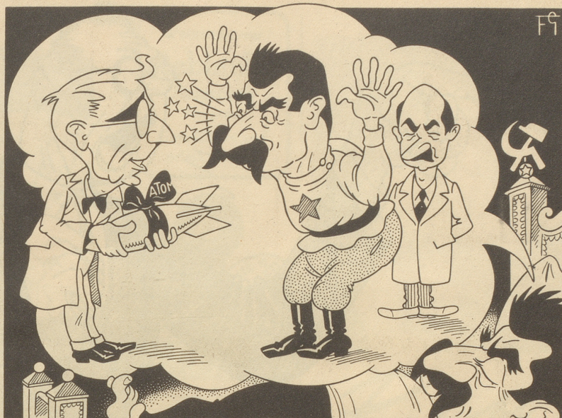
Die Atombombe verliert ihre Gefährlichkeit

Nach der Abstimmung über das Familienschutzgesetz, das bekanntlich nur von den Außer-Rhodern abgelehnt wurde, machte sich in den Pressekommentaren ein großes Werweisen nach den Verwerfungsgründen bemerkbar. Der Entscheid war unbegreiflich. Wenn die Redaktoren der Gazetten die Geschichte von jenem Appenzeller gekannt hätten, der unlängst nach Amerika reisen wollte, so hätten sie weniger nach den Gründen fragen müssen. Der Appenzeller wollte also nach Amerika reisen. Das Schiff stieß halbwegs auf eine Mine und sank. Der Appenzeller wäre auch fast ertrunken, er konnte sich nur noch an eine Planke klammern und wurde von der Strömung an eine Insel geschwemmt. Dort wurde er halbtot geborgen. Sofort wurde ihm eine Stärkung verabreicht. Nachdem