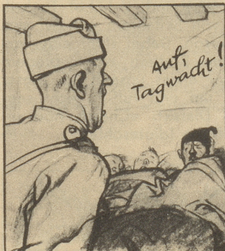
„Mitten in der Nacht“, seufzt Peter. „Der Korporal hätte uns wohl noch ein paar Stunden drein geben können!“

Noch gefährlicher aber ist es, ihn in Unkenntnis über das eine und andere zu lassen. Blaise Pascal, 1623—1662.