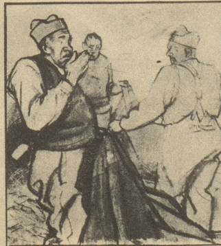
Und nun beginnt das übliche Morgen — Hust-Konzert — fast so unvermeidlich wie der weckende Korporal. Das kommt natürlich von dem langweiligen Strohstaub!