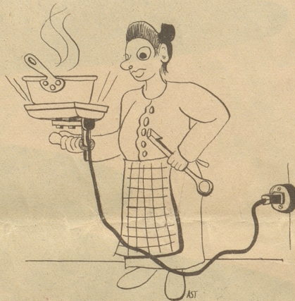
Pfrau Merkli chochet elektrisch