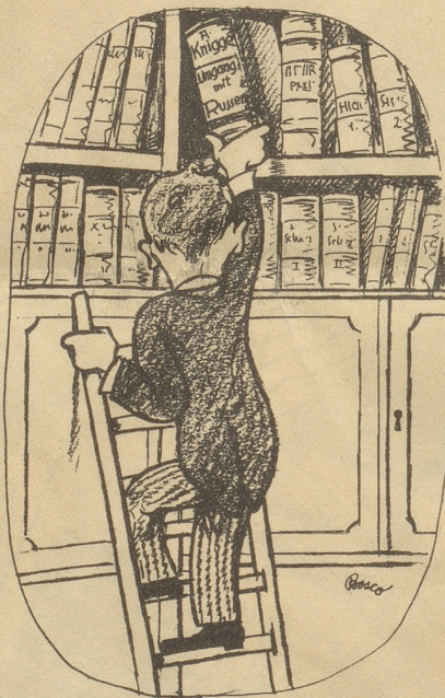
Dr. Max Petitpierre hat sein Amt als Bundesrat angetreten

Schreib' es Dir auf, ja nicht vergessen: Im „Central“ kannst Du prima essen.