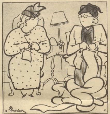
„Es schaudert mich beim Gedanken, daß ich diesen Strumpf wieder aufziehen muß.“ Illustrated

Ich glaube, von jetzt an laß ich die weißen Fäden im Haar ... Valérie.