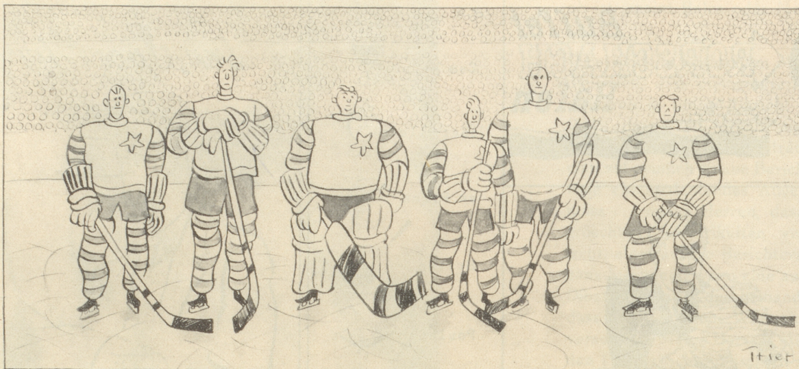
Die Helden in der Arena